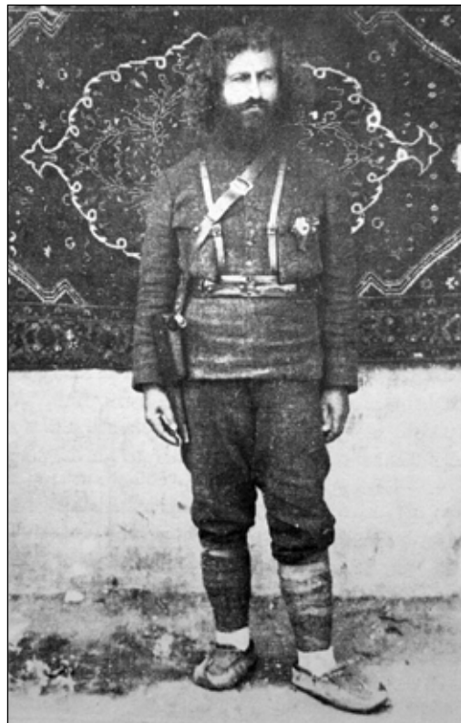
تصویر ۴. میرزا کوچک جنگلی پیش از مسافرت به لنگران (تصویری از کتاب سردار جنگل ابراهیم فخرایی، ص ۲۲۹).

مذهبی یا سیاسی از مهم‌ترین ویژگی‌های این آثار بود و محبوبیت و پذیرش این آثار را از آن جهت که هم در فرم و هم در اجرا ساده و قابل درک بودند، در میان توده‌ها افزایش داد» (کشمیرشکن، ۱۳۹۳: ۲۲۰). بنابراین آنچه خط تحولات تصویری پیش و پس از انقلاب را جهت می‌دهد نه رویکرد مغایر با قبل، بل امتداد خط ممتدی است که به ظهور اهداف، اندیشه‌ها و آرمان‌هایش نزدیک می‌شود. خطی که با تاکید بر سنت‌های از دست رفته، بازگشت به ریشه‌ها و نشانه‌های اسلامی و ملی، دنباله‌رو هویت فرهنگی است تا تعادلی میان گذشته و مدرنیسم ترسیم کند.