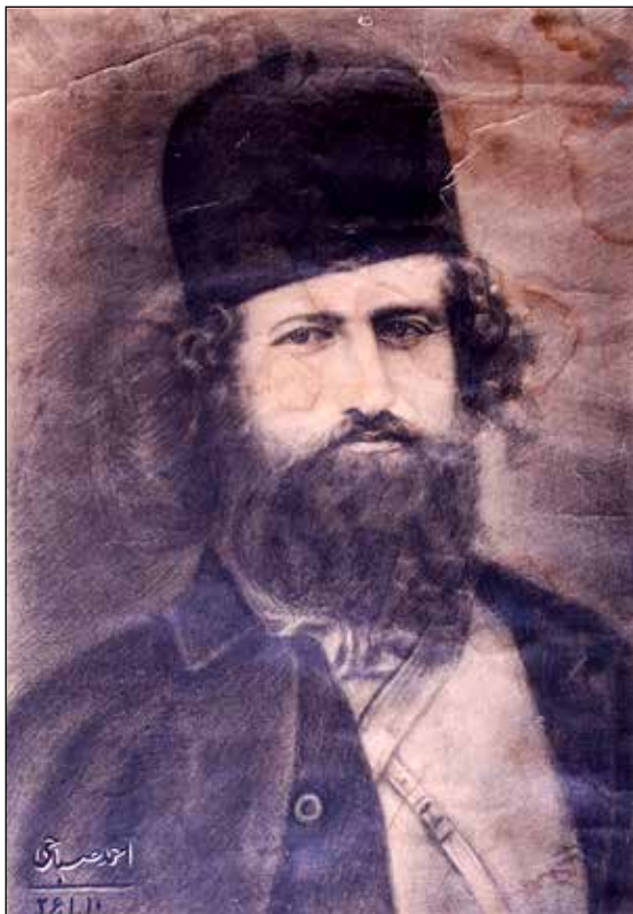
تصویر ۱۰. نقاشی چهره میرزا کوچک خان جنگلی، سنه ۱۳۲۶ هجری قمری، عمل احمد صباحی، یکی از معدود تصاویر نقاشی شده از چهره میرزا، پیش از مجموعه یاد سبز قاسم حاجی‌زاده.

در بزنگاه‌های حساس تاریخ ایران به کرات بازآدآوری شده است و تنها با ورود اندیشه‌های مدرن دوره پهلوی به ایران، رویکردی ناسیونالیسم می‌یابد. روایت حاجی‌زاده از مجموعه جنگل، گفتمان ملی و اندیشه پایداری است که نه وارداتی بل هویت‌گراست؛ در میان گفتمان‌های مدرن، گفتمان اصالت‌گرا و چپ، گفتمان اسلامی در آمیختن با گفتمان ملی سویه پاسداشت قهرمانان ملی و سنتی را برمی‌گزیند که از دهه‌های ۳۰ و ۴۰ شمسی تا پس از انقلاب و جنگ ادامه می‌یابد. به نظر به جرأت می‌توان بر این نکته صحه گذاشت که رویکرد تبلیغی آن در گفتمان بازگشت به خویش‌نشدن و سنت‌گرایی و بازتاب غالب آن در جریان‌های فکری هنرمندان سقاخانه امتداد یافت و زمینه‌های اجتماعی آن در آثار هنرمندانی چون حاجی‌زاده، پتگر، آشتیانی و شیبانی ظهور پیدا کرد. بنابراین سویه گفتمانی ملی-اسلامی آثار جنگل حاجی‌زاده نه رویکردی تقلیدی و تبلیغی بل سویه‌ای عامه و مردمی دارد. سویه‌ای که هم‌چون دیگر آثار او به قصد گفت‌وگو در میان لایه‌های مردمی و بالاخص روایت‌های جامعه سنتی و فولکلور روستایی به وجود آمده است.