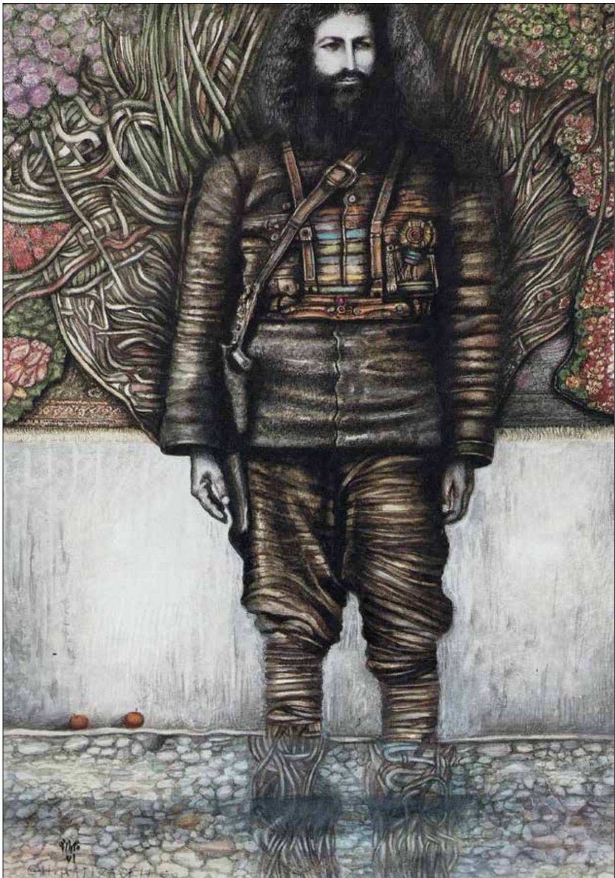
تصویر ۳. قاسم حاجی‌زاده، بدون عنوان [میرزا کوچک جنگلی]، ۱۳۶۱، ۲۸ در ۴۰ سانتی‌متر، گواش و اکریلیک، (مجموعه یاد سبز، مجموعه نقاشی‌های میرزا کوچک خان جنگلی، ۱۳۷۱، ص ۷۳).