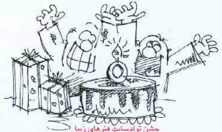
جشن تولد سایت هنرهای زیبا در غرفه دانشگاه تهران

توی غرفه‌ی دانشگاه بین المللی قزوین هیچ‌کس تحویلمون نگرفت... همه سرشون به کار خودشون بود... خیلی بچه‌های سر به زبیری بودند... بابا، دشونم گرم...!