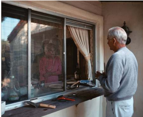
تصویر ۳. گفت‌وگویی از آن طرف پنجره آشپزخانه، ۱۹۸۶

صورت که عرضه انکاره‌های عکاسانه (بدون مداخله عکاس) از طریق عکس‌ها غیرممکن می‌نماید. از این منظر سوپرکتیویته نیز به همین گونه دچار تفاوت می‌شود و آن وابستگی بی‌چون و چرای آن به تفسیری است که متأثر از تجربه بشری است و در واقع گونه‌ای فردی‌تر از یک اثره کلی‌تر را می‌نمایاند.