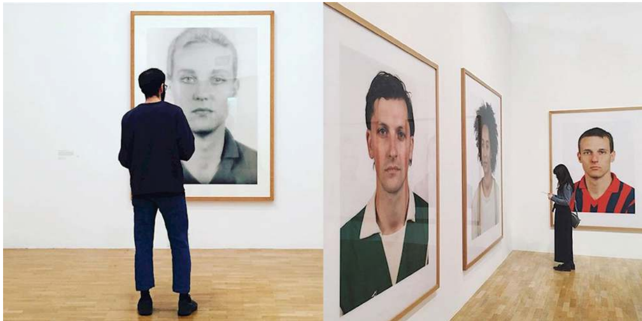
تصویر ۸. بخشی از نمایشگاه پرتره‌های توماس راف

قرار می‌دهند که پس از ۱۹۶۰ این گونه عکاسی موجبات ظهور گونه‌ای از هنرمندان را مهیا ساخت که در اصطلاح «هنرمندان به کاربرنده عکاسی» نام‌گذاری شدند و هنر به طور فزاینده‌ای عکاسانه شد. (campany, 2003: 132)