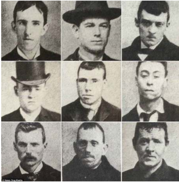
تصویر ۶. نمونه‌ای از چهره‌نگاری‌های ابتدایی

شگرفی از شرایط غرب قرن ۱۹ را به ما می‌رساند. آلن سکولا ۱۲ نظریه پرداز شهیر عکاسی بر این باور است که چهره‌نگاری‌های جنایتکاران بر پیامدهای اندیشه‌های در حال شکل‌گیری در زمینه چهره‌شناسی و جامعه‌شناسی و حتی مفاهیم و پروژه‌های اصلاح نژادی نیز تأثیر گذار بوده است (Sekulla, 1989: 130). (تصویر ۶) یکی از مهم‌ترین این فعالیت‌ها در زمینه اصلاح نژادی که به کار بست چهره‌نگاری‌های عکاسانه انجامید و مفاهیم پرتره‌نگاری را وارد فضایی تازه از زمینه‌های تی وریک نقد و تفسیر کرد، مجموعه فعالیت‌های پژوهش