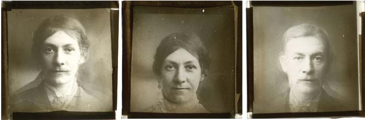
تصویر ۷. از مجموعه تهیه شده توسط فرانسیس گالتن از زندان میل بانک