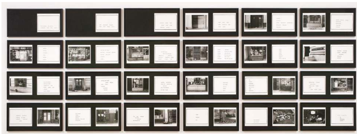
تصویر ۴. از مجموعه مارتا روسلر، منطقه باوری در دو نظام توصیفی نابسنده

در نیویورک را نشان می‌دهد و این در حالی است که در هیچ‌یک از این تصاویر اثری از فرد قربانی دیده نمی‌شود و تنها به ذکر اصطلاحاتی عامیانه از شرایط زندگی آن منطقه پرداخته می‌شود (تصویر ۴).