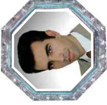
حسین پیات ملیله کاری